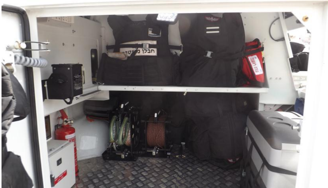
מבט מזדלת אחורית